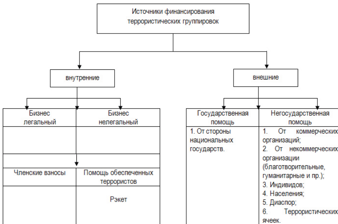
Рисунок 2. Источники финансирования международного терроризма

По мнению террологов, происхождение террористической организации определяет их финансовую подпитку. В этой связи отечественный ученый Ю.В. Латов в своем исследовании предлагает такую классификацию [5, с. 27]: