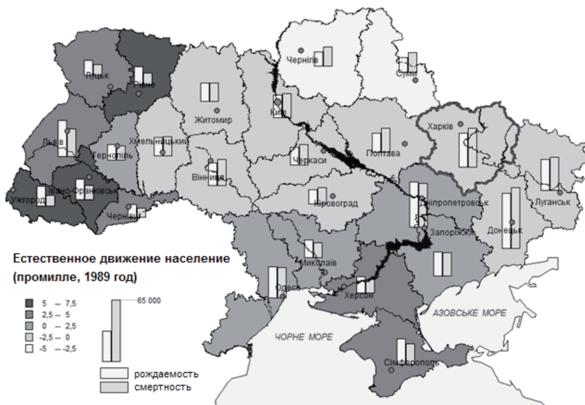
Рис. 1. Естественное движение населения Украины, 1989 г. (по данным переписи населения 1989 г.[2])

Ко второй группе относят северную, центральную и восточную части Украины (включая Харьковскую область). В 1989 г. Харьковская область, по показателю естественного прироста населения (-1,4 ‰), занимает 22 место. Самые высокие показатели естественной убыли в 1989 г. зафиксированы в Черниговской (-4 ‰), Сумской (-3,1 ‰), Полтавской (-2,5 ‰) и Черкасской (-2,1 ‰) областях. Отрицательные показатели естественного прироста этих областей обусловлены структурой населения (значительной когортой старшей возрастной группы); также сказались последствия аварии ЧАЭС, приведшей не только к повышению смертности, но и к уменьшению рождаемости (особенно это относится к Черниговской и Сумской областям). Депопуляционные показатели зафиксированы также в Житомирской, Луганской, Хмельницкой, Киевской, Донецкой, Кировоградской и Винницкой областях.